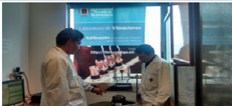
IMAGEN DEL PROYECTO